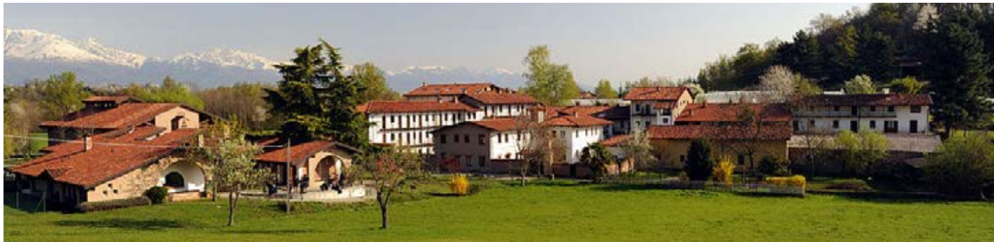
Cymuned fynachaid Bese yng ngogledd yr Eidal